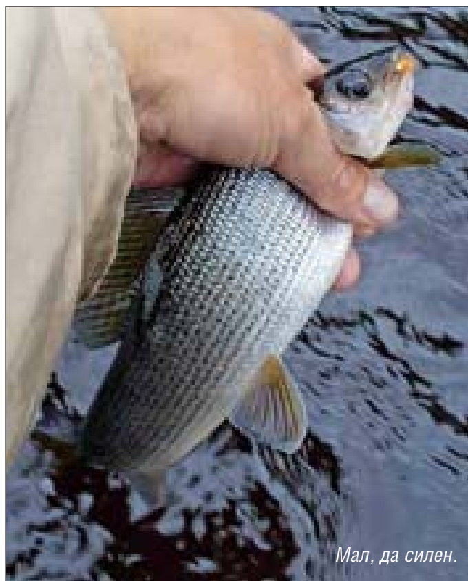
Мал, да силен.