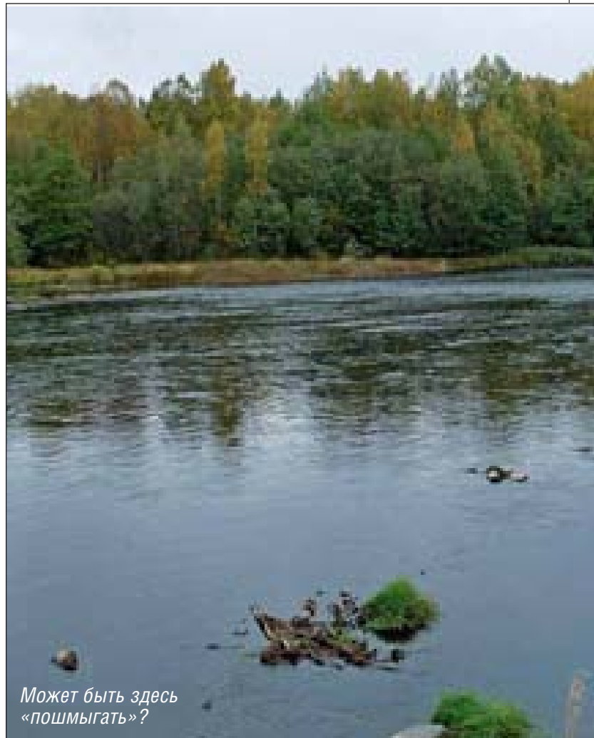
Может быть здесь «пошмыгать»?

Тут начинается самое трудное и интересное. Хариус – рыба хитрая, пугливая и непредсказуемая. Подобрать обманку для европейского хариуса на Вологодчине особого труда не составляет. Основной проб-