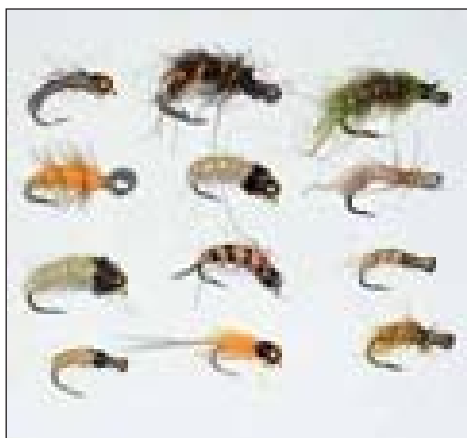
Некоторые «правильные» мушки дальневосточных мастеров; слева – самодельные «обманки» автора.

подсечки на расстоянии иногда более 10 м, а во-вторых, для вываживания сильно упирающейся рыбы, которой помогает течение. У меня есть пара